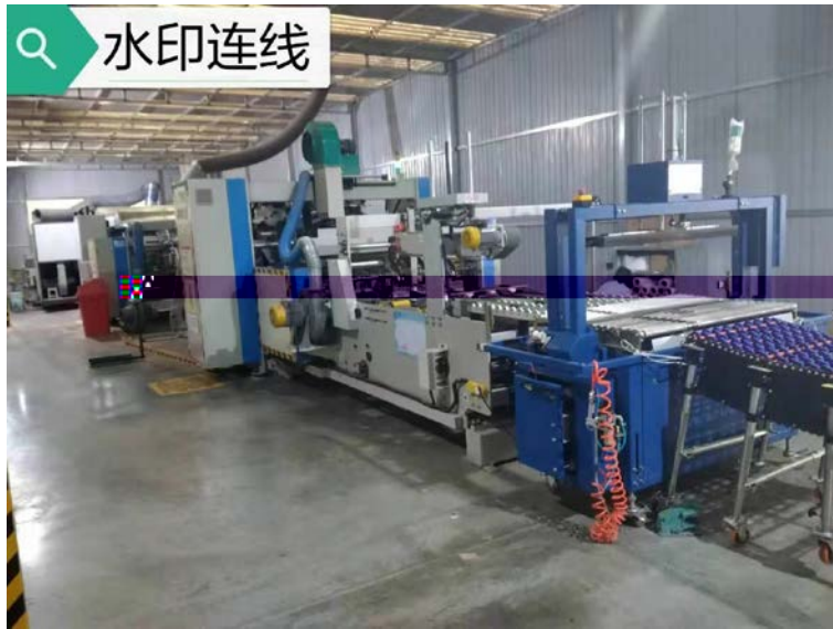
. 4-2 gj