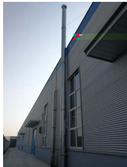
. 7 15m Â"D1,