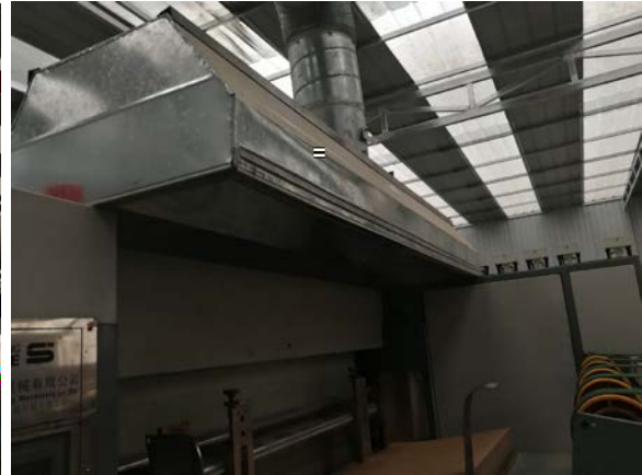
. 4-3 gj: éLö"D5™