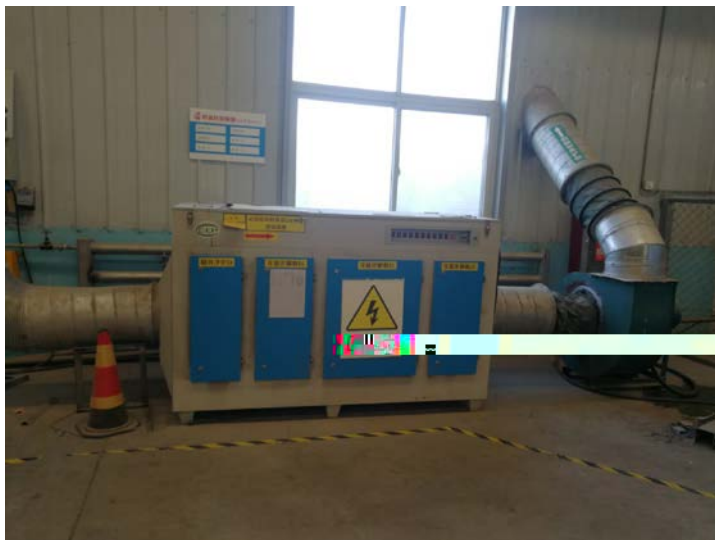
. 6 y"W Ü F>65ž