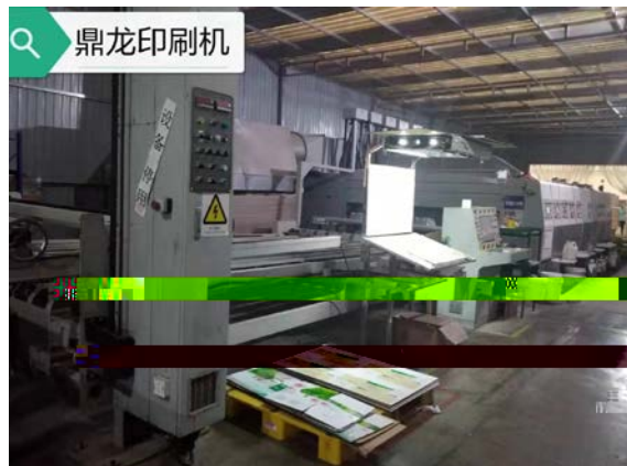
. 4-1 g j