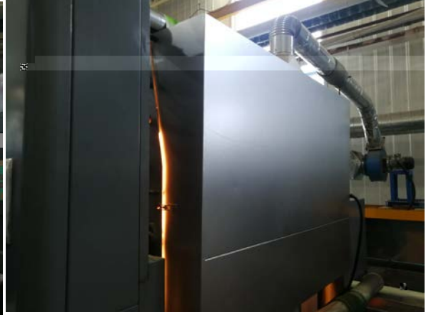
. 4-5 g jLÖ"D5™